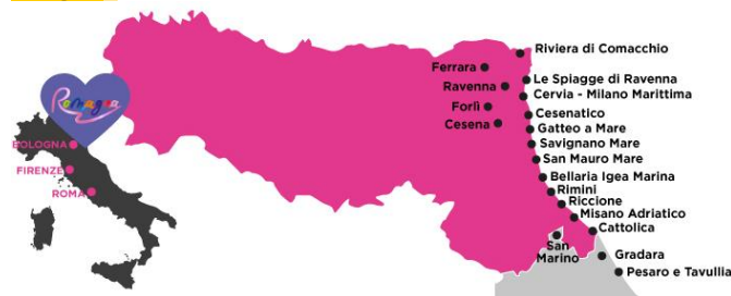
> Fig. 2 Località coinvolte nella Notte Rosa 2019

16 mila realtà, che costituiscono il 22,3% del totale delle imprese dell'area. I settori principalmente coinvolti sono il commercio al dettaglio con 6.611 imprese (41,8% sul totale delle imprese attive nel turismo romagnolo del divertimento/movida), 4.925 imprese di ristorazione (31,2%), 2.608 imprese della ricettività (16,5%), 1.299 realtà collegate alle attività sportive e del divertimento (8,2%), 220 agenzie di viaggio e tour operator (1,4%) e 146 imprese legate alla produzione cinematografica e televisiva (0,9%). Quasi il 28% del totale di tali imprese è presente nella provincia di Rimini. La Notte Rosa, fin dalla sua prima edizione nel 2006, è stata quindi concepita come una modalità di riposizionamento della destinazione e dell'intrattenimento serale in Riviera, non solo legato ai giovani, ma rivolto anche alle famiglie. Spiagge, centri storici, entroterra, borghi e castelli uniti da musica cibo, divertimento, shopping, arte e cultura: il cosiddetto "Capodanno dell'estate italiana" coinvolge 130 chilometri di costa dalla Riviera di Comacchio a Pesaro, per un totale di sedici località tra la costa romagnola e quella del Nord delle Marche.